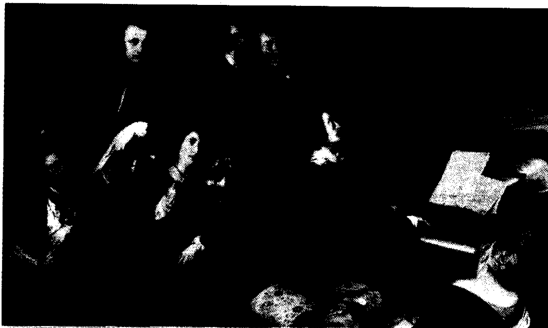
Franz Liszt al pianoforte.